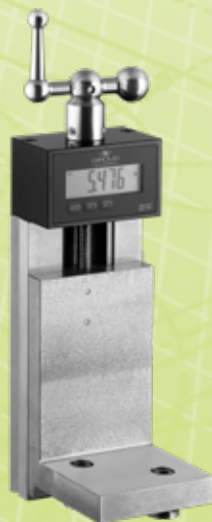
Coulisse Y Y Schlitten Y slide