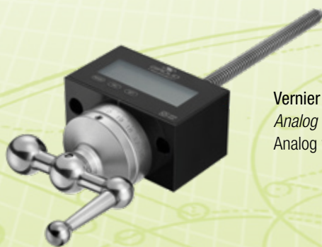
Vernier analogique (1mm ou 2mm) Analog Nonius (1mm oder 2mm) Analog vernier scale (1mm or 2mm)

Choice of screw pitch (1mm or 2mm), analog vernier scale, chemical nickel plating, scraping.