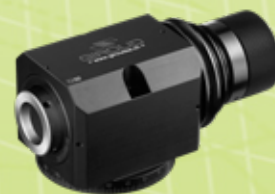
Broche W20 Spindel W20 Spindel W20