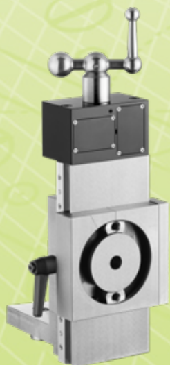
Coulisse Y avec base broche Y Schlitten mit Spindelbasis Y slide with spindle base